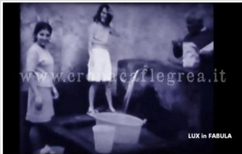
Un frame del video

POZZUOLI - Il Rione Terra raccontato con immagini inedite del 1968. Un tuffo nel passato tra i vicoli dello storico quartiere, pezzi importanti dell'antica Rocca, molti dei quali oggi scomparsi. Le immagini raggruppate in un video, realizzato dall'associazione Lux in Fabula , descrivono gli anni successivi