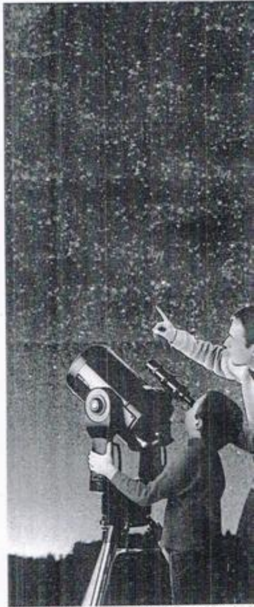
L'iniziativa A Città della Scienza domenica la Giornata Internazionale

Quali: Giornata Internazionale dei Planetari Dove: Città della Scienza in via Coroglio Quando: domenica dalle ore 11